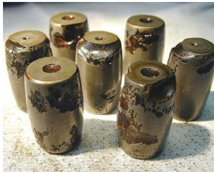
Rulli da un cuscinetto orientabile a rulli contraffatto

Se vengono installati in apparecchiature critiche per la sicurezza, i prodotti contraffatti rappresentano un grosso rischio per la sicurezza delle persone e/o l'ambiente.